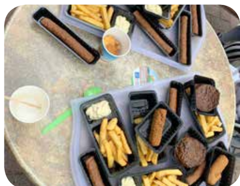
Culinair genieten in Drouwenerzand