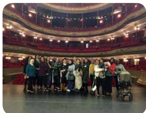
Rondleiding in de Stadsschouwburg